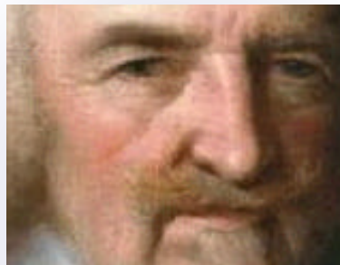
Politik: für Thomas Hobbes in gewisser Weise eine Frage der Ehre

Verallgemeinernd ausgedrückt: Es gibt keine Notwendigkeit zur Annahme, dass es ein zoon politikon gebe, das dem homo oeconomicus Einschränkungen auferlegte. Wenn und solange der Mensch als zoon politikon auftritt, dann vielleicht deshalb, weil er als homo oeconomicus annimmt, dies sei die wirtschaftlichste Art, das anstehende Problem zu lösen.