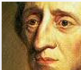
John Locke: Arbeit als Grundlage der Appropriation

heit sagen ist nützlich für die Kommunikations-Gemeinschaft. Richtig. Aber das Handeln der Individuen wird damit nicht erklärt. Dafür muß gezeigt werden, daß es im Normalfall für das Individuum vorteilhaft ist, die Wahrheit zu sagen. Der Sprecher baut damit einen Aspekt seiner Reputation auf: daß man sich auf das, was er sagt, verlassen kann. Er gewinnt Vertrauen, wird in der Gruppe ernst genommen.“ 7