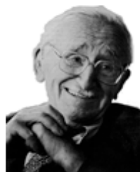
Preisträger Hans-Olaf Henkel und Antonio Martino