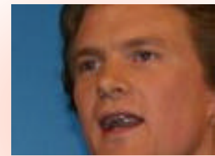
Standing ovations für den Festredner Johan Norberg