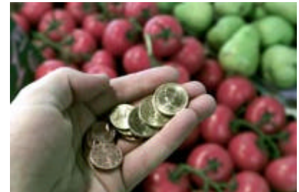
Freier Marktzugang: künftig schwerer in den USA?

Die Große Depression der frühen 30er Jahre wird vornehmlich mit dem "Schwarzen Freitag" des Oktober 1929 in Verbindung gebracht, an dem die New Yorker Börse seinerzeit ihren ersten großen Einbruch erlitt. Aber dieser Einbruch hätte nicht eine langjährige Krise der Weltwirtschaft hervorrufen können.