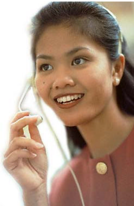
Asiatische Telefonist(inn)en sind John F. Kerry ein Dorn im Auge.