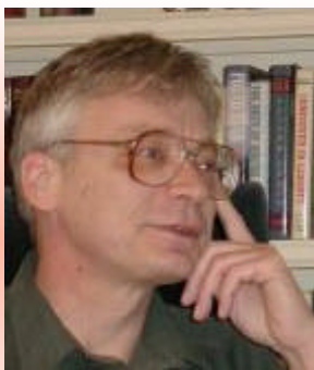
Prof. Dr. Hans-Hermann Hoppe