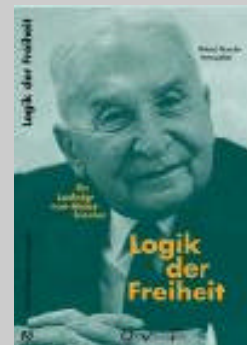
Logik der Freiheit. Ein Ludwig von Mises-Brevier , hg. von Roland Baader Thun (Schweiz): Ott Verlag, 2000

Roland Baader , Diplom-Volkswirt (diplomiert bei F.A. von Hayek ), gilt als herausragender Freiheitsdenker der Gegenwart im deutschen Sprachraum. Von seinen zahlreichen Publikationen ist zuletzt (im Resch-Verlag, Gräfelfing) erschienen: totgedacht. Warum Intellektuelle unsere Welt zerstören (rezensiert in der Februar-Ausgabe des CNE-Monatsmagazins). Als Einführung in das Werk von Ludwig von Mises eignet sich besonders das von Roland Baader herausgegebene Mises-Brevier Logik der Freiheit (Ott Verlag, CH-Thun).